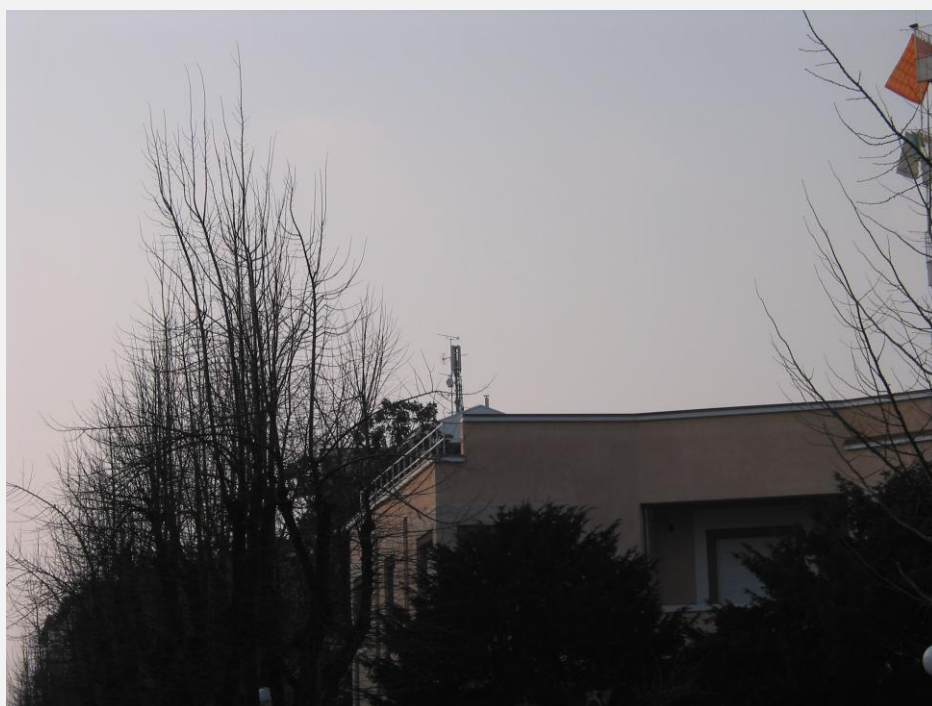
Zone di Installazione Condizionata Impianto non sporgente dal colmo o da altri corpi edilizi esistenti per più di 4,50 m