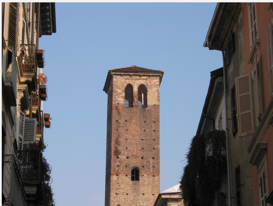
Zone di Installazione Condizionata Mimetizzazione dell'impianto